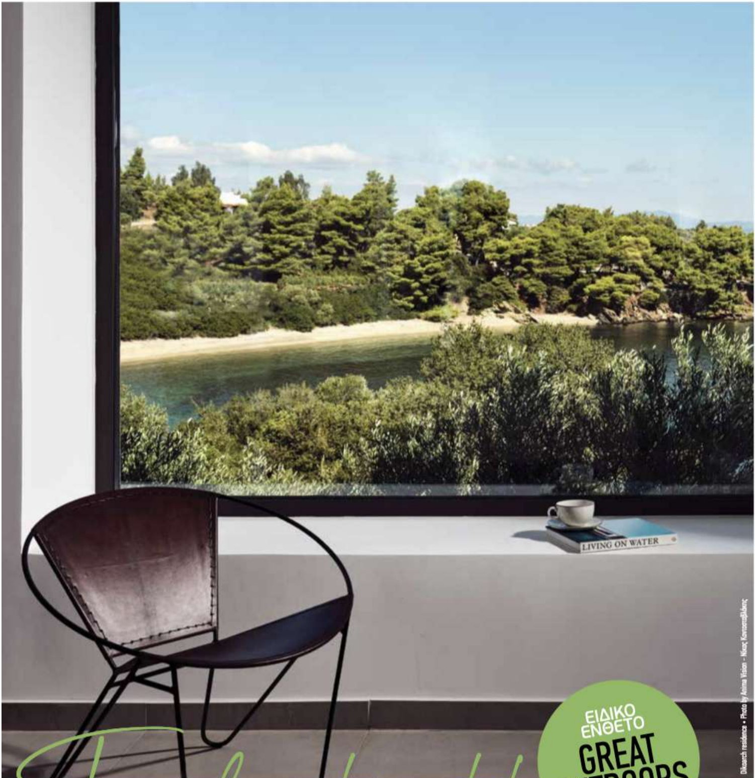
Dikoaarch residences • Photo by Anna Wilson - Nicot Konstantinidou

COZYHOME 44 | Design Magazine | SPRING 2022